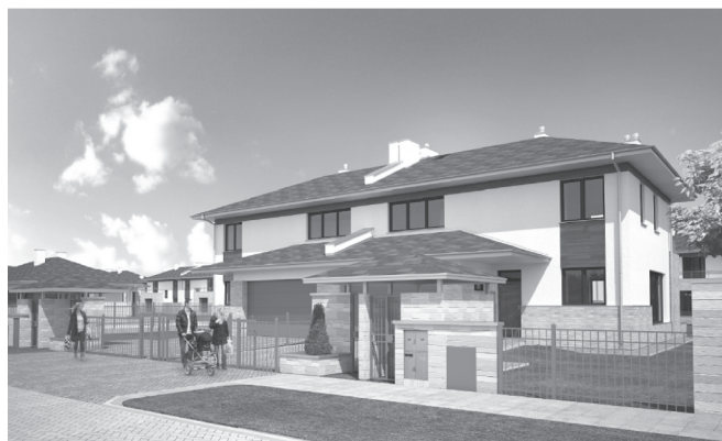
Wizualizacja budynku bliźniaczego C2` o pow. 156,7 m 2

Na osoby, które myślą o zakupie mieszkania , na osiedlu Przylesie czekają jedno, dwu i trzypokojowe lokale w budynku 10B powstającym przy ul. Akademijnej. Cena metra wynosi 4800 zł brutto niezależnie od piętra i powierzchni lokalu.